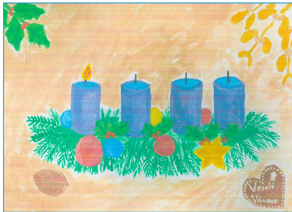
Ilustrace Adventní věnec: Katka Šlemendová, 7. B, ZŠ Edvarda Beneše, Písek

Na Mikuláše, anděla a čerta nevěřím už dávno. Vždyť už chodím do druhé třídy! Takže vím, že tyhle postavy jsou převlečení lidé. A dokonce jsem odhalil, že jsou všichni od nás z baráku.