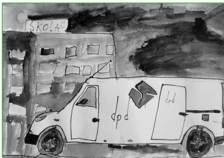
Patrik: Co budu jednou možná dělat