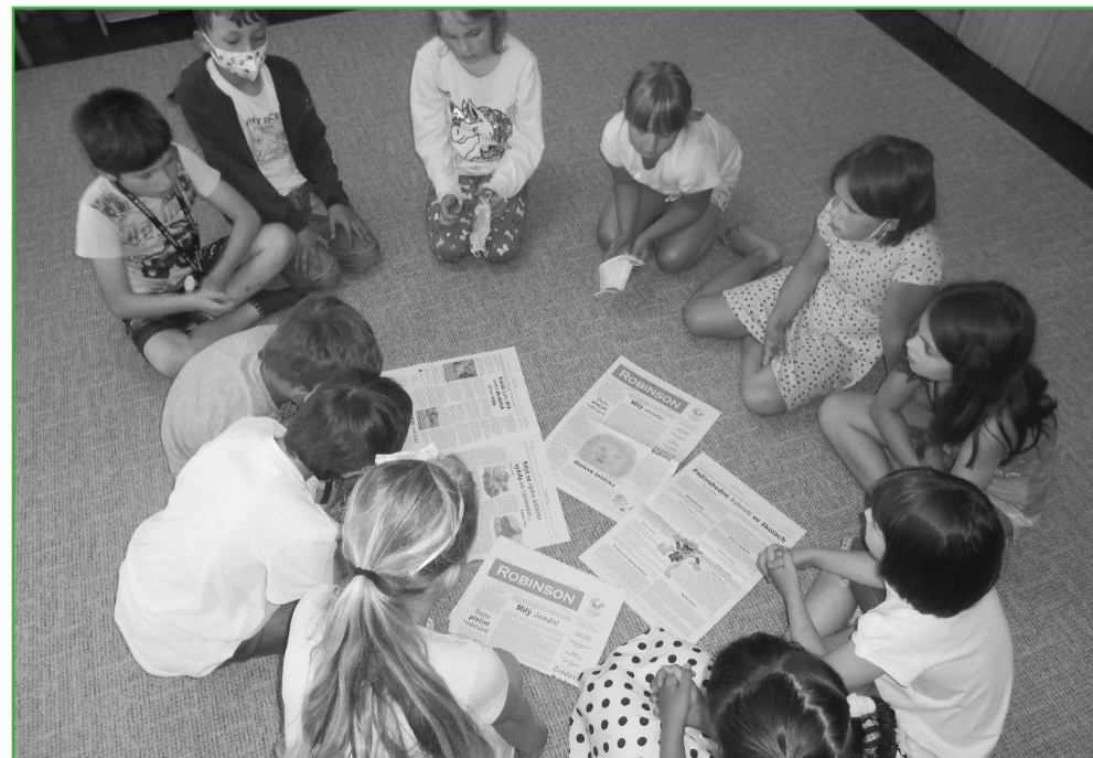
Dostali jsme krásné fotografie od paní vychovatelky ze školní družiny ze šumavské Základní školy v Žihobci. Máme z nich takovou radost, že se vám alespoň s jednou musíme pochlubit. Děkuje.