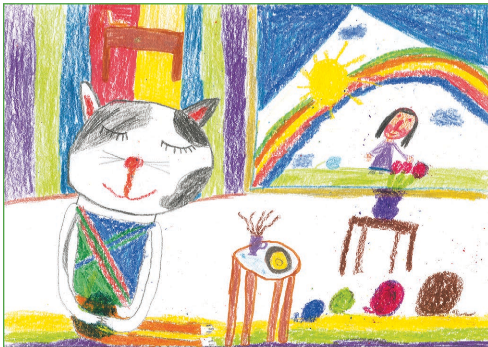
Nakreslila Barbora Soukupová, 2. B, ZŠ Kubatova, České Budějovice