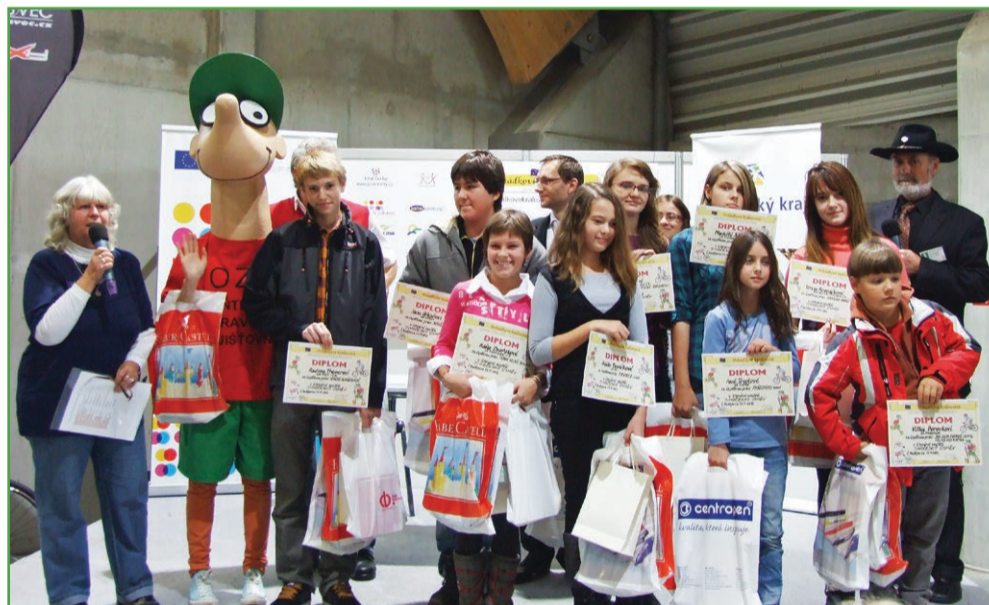
Vítězové literární soutěže Jihočeský úsměv při předávání cen na Festivalu dětských knih, časopisů a her. Stalo se tak na Výstavišti České Budějovice koncem loňského roku.