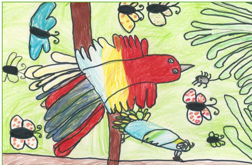
Ilustrace Papoušek Ara: autorka Aneta Pavelková, 2. tř. MŠ a ZŠ Žimutice