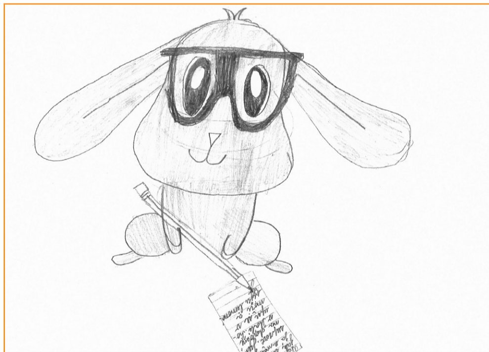
Pes spisovatel - nakreslila Klára Klimková, 4. tř. ZŠ Dobřichovice