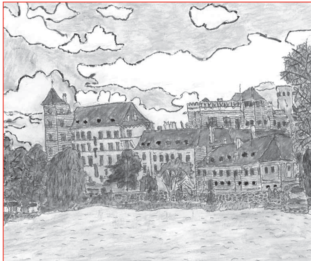
Autor: Viktor Karba, z Domova pro osoby se zdravotním postižením, Osek u Strakonice