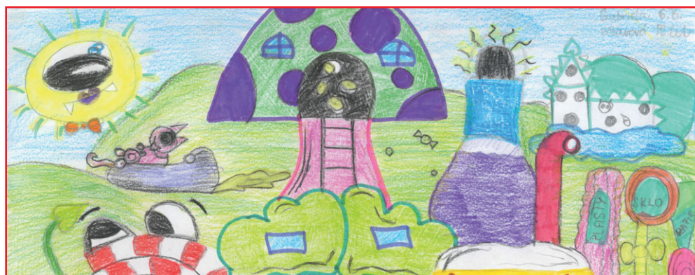
Nakreslila Gabriela Voloufová, 6. B, ZŠ Dubné

Dneska máme devítiletou povinnou docházku a dvouměsíční letní prázdniny, které už přešlapují před dveřmi – i pro vás... Hanka Hosnedlová