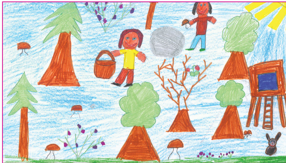
Sbírání hub v lese - nakreslila Blanka Soukupová, 8 let, ZŠ a MŠ Žimutice