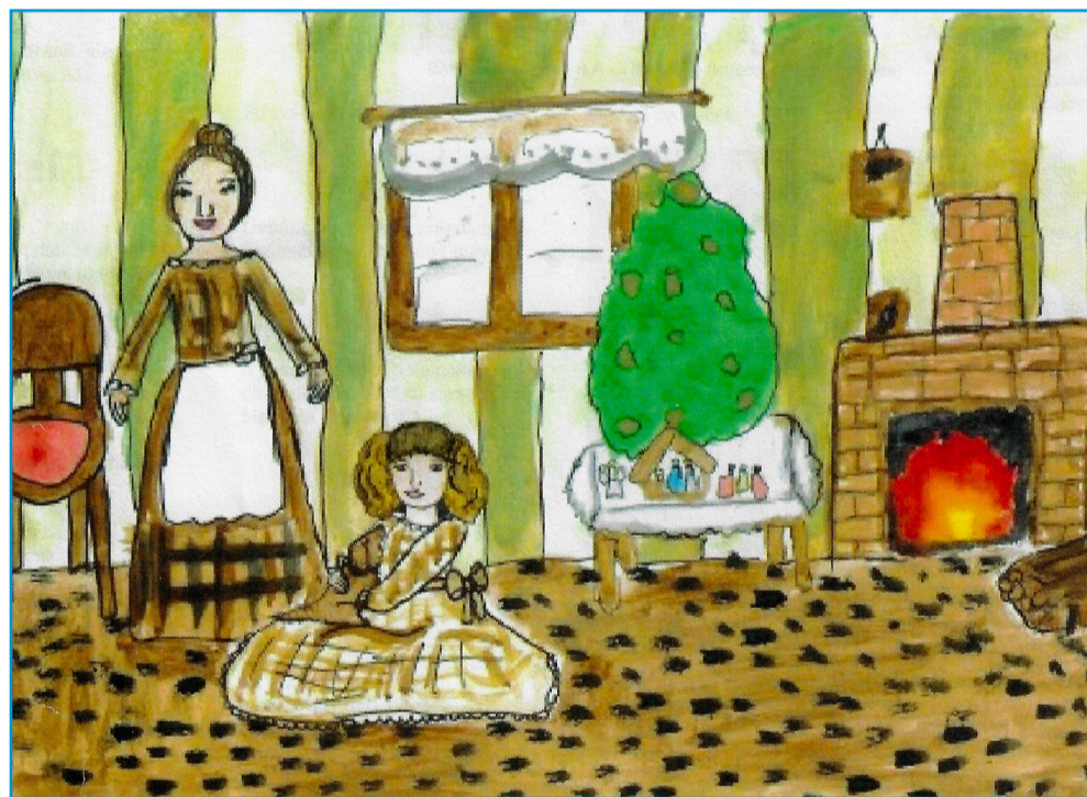
Vánoce (kolorovaná perokresba), autorka: Tereza K., ZŠ E. Beneše, Písek

Když ze mě smutek opadne, jako by ho ze mne smetla kouzelná hůlka, zvednu se a odcházím těch několik kroků pryč z lesního pelíšku jelenů. Naposledy se ohlédnou za obrazem cennějším než drahe kamení, a potom les spatřil slzy podzimu a úsměv můj jak zvadlé listí.