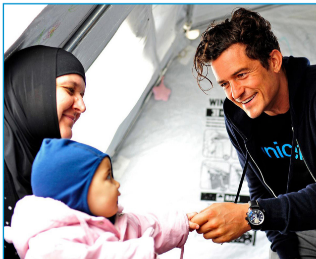
Orlando Bloom podporuje UNICEF již 12 let. Vyslancem dobré vůle byl jmenován v roce 2009 a od té doby intenzivně navštěvuje programy UNICEF v terénu a podává svědectví o životě dětí v nejchudších zemích a krizových oblastech světa.