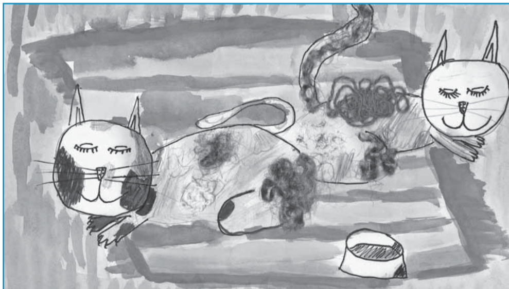
Přejeme vám v celém příštím roce takovou pohodu, jakou prožívají kočičky na titulním obrázku dětského kalendáře 2012. Autor: Jakub Pánek, 5. C, ZŠ Kubatova, České Budějovice.