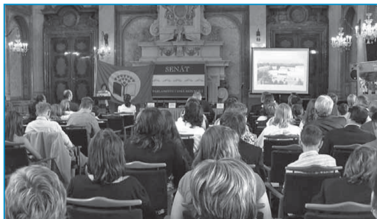
Přebírání titulu EKOŠKOLA

V České republice se ekotitulem může pochlubit zatím necelá stovka škol. Navíc je toto ceněné označení propůjčováno pouze na dva roky, takže v žádném případě nelze usnout na vavřínech. Titul je třeba nejen obhájit, ale navíc ekologické aktivity