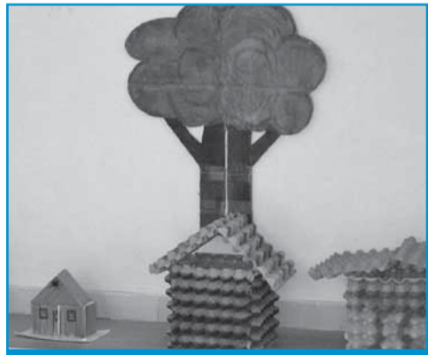
Výrobky z odpadů

„Projekt je postaven hlavně na žácích a jejich spolupráci s učiteli, vedením školy i dalším personálem ve škole. Kluci a děvčata se zaměřují na různé ekologické problémy, ať už jde o úsporu energií a vody, o sběr a třídění odpadů, o péči o prostředí školy a jejího okolí, o rozšiřování zeleně, sázení stromů či o zahradu, kde se mimo