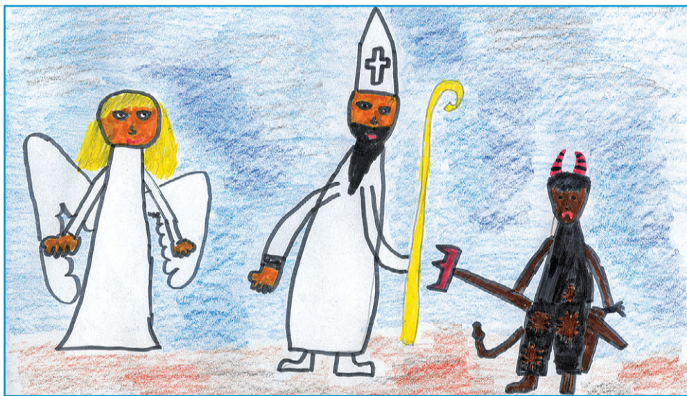
Nakreslil: Daniel Scheicher, 3. A, ZŠ Kubatova, České Budějovice