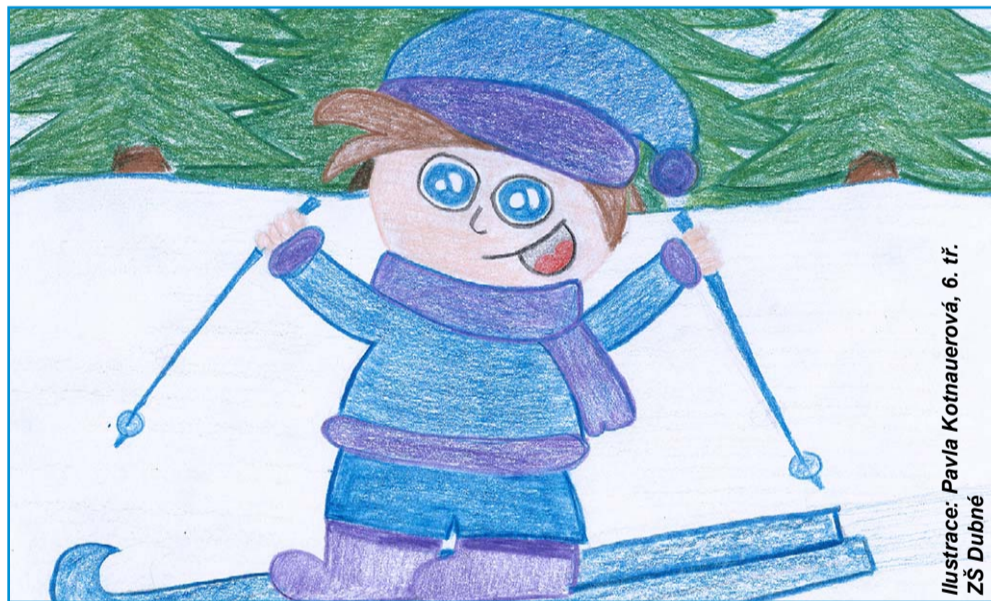
Ilustrace: Pavla Kotnauerová, 6. tř. ZŠ Dubné